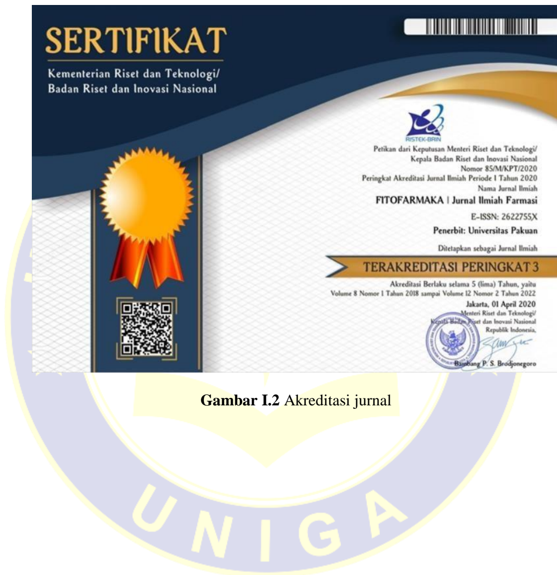
Gambar I.2 Akreditasi jurnal