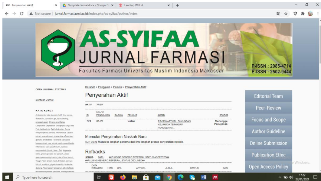
Gambar I.1 Bukti Submit Jurnal