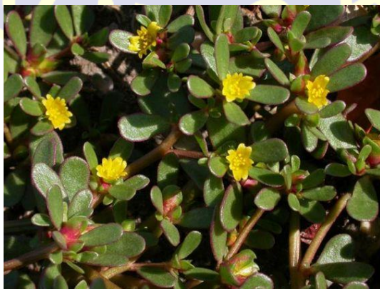
Gambar II.1.5 Bunga Krokot