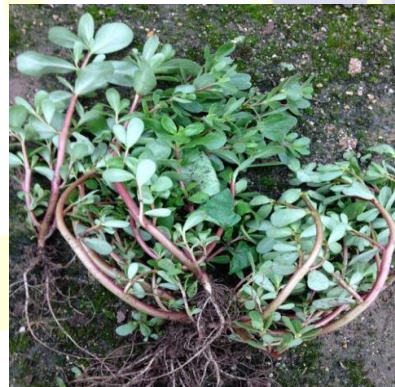
Gambar II.1.4 Akar Krokot