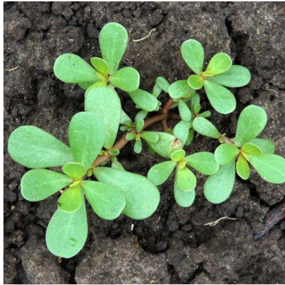
Gambar II.1.1 Tanaman Krokot