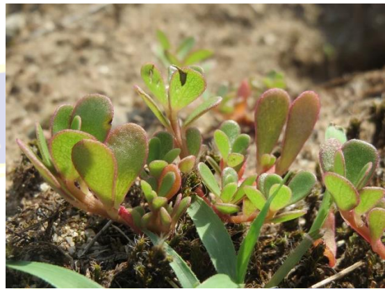
Gambar II.1.2 Daun Krokot