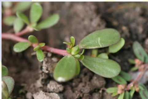
Gambar II.1.3 Buah Krokot