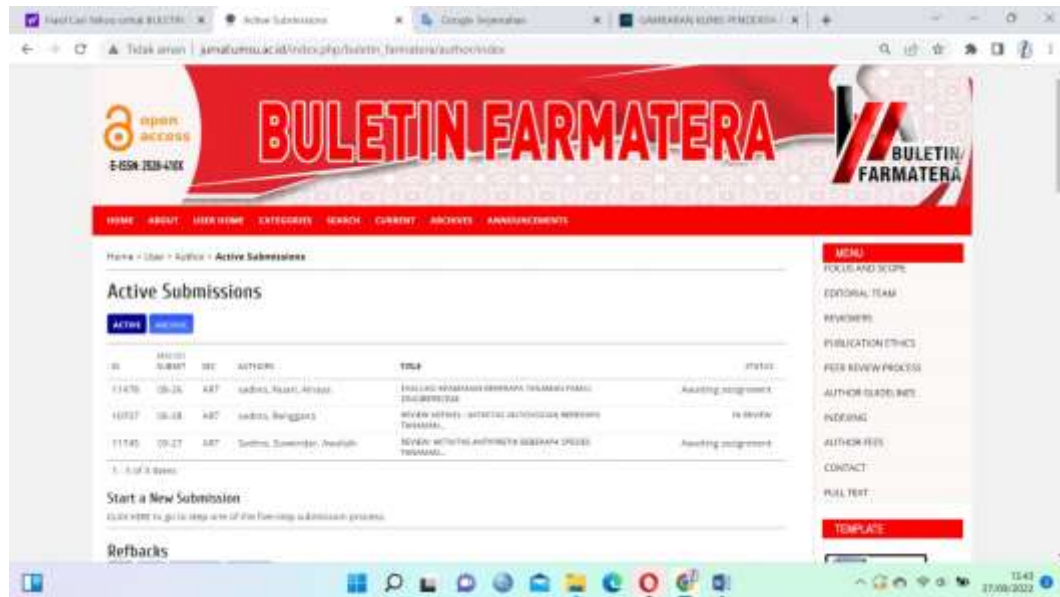
Gambar II.2. Bukti Submite Manuskrip