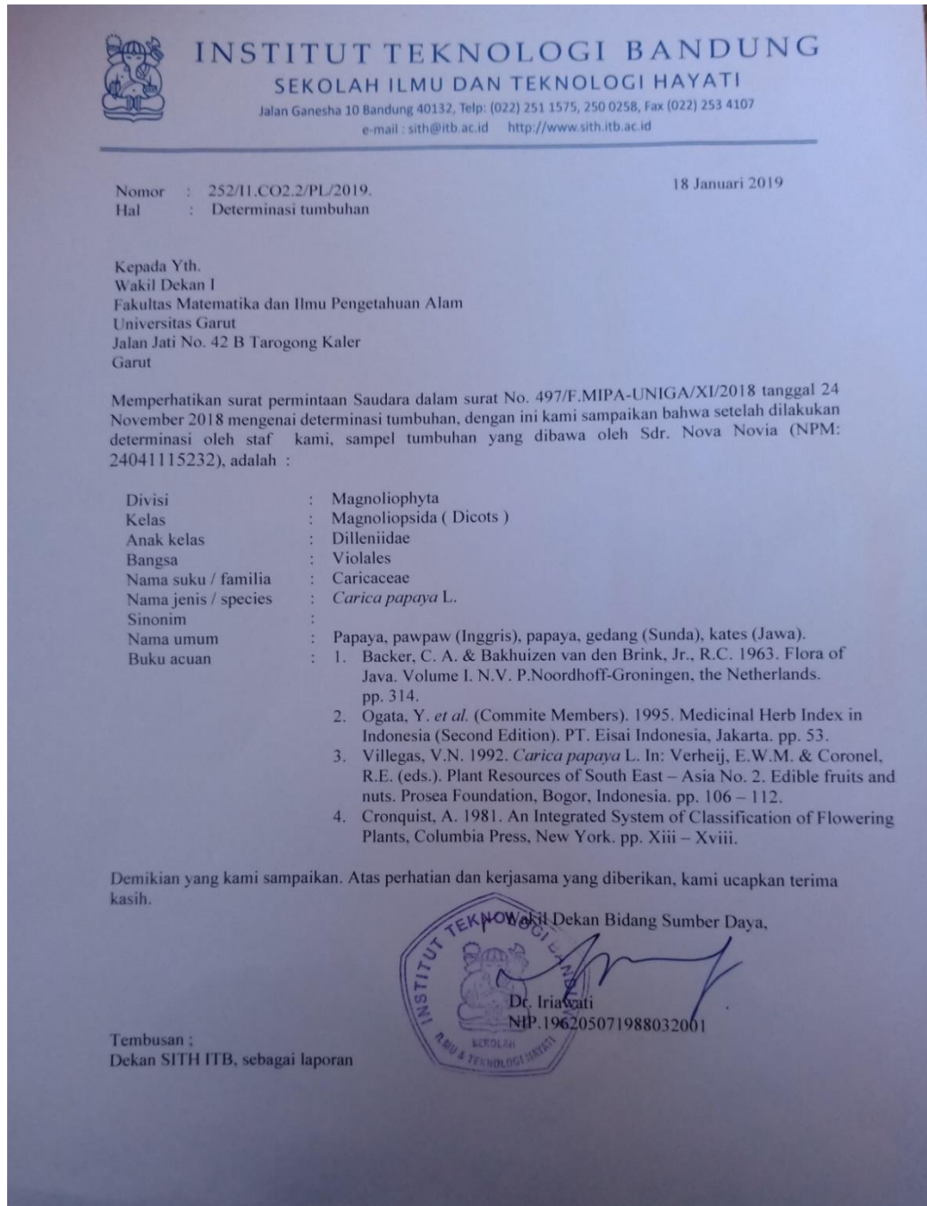
Gambar V.1 Hasil determinasi biji pepaya ( Carica papaya L )